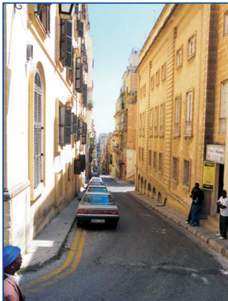
St. Ursula Street, nejdelší ulice ve Vallettě, měří jeden a čtvrt kilometru.