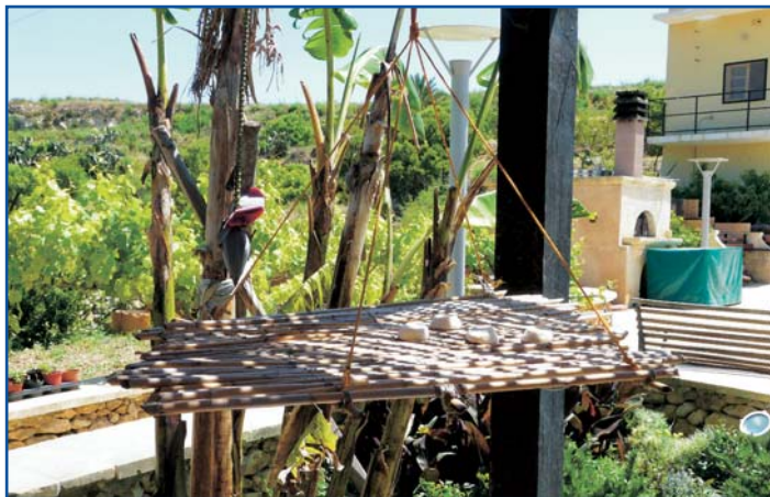
Starý způsob sušení ovčího sýra gbejna na farmě Ta Mena Estate