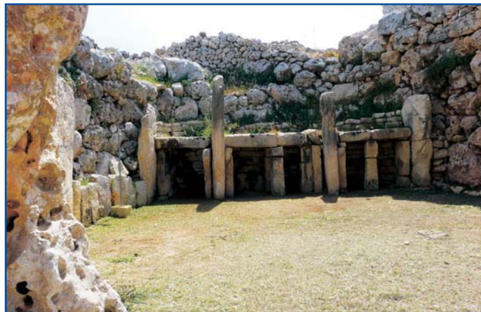
Nejstarší megalitický chrám Ggantia Temples u města Xaghra na ostrově Gozo

do přístavu Mgarr. První obyvatelé se zde usadili zhruba 3600 let před Kristem. Ostrov je oproti Maltě menší a čistší. Naleznete zde nejstarší gigantické chrámy na světě. Má rozlohu 67 km 2 , počet obyvatel je 30 000.