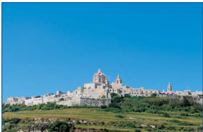
Mdina, takzvané tiché město a bývalé hlavní město

na ostrovech a odhaduje se, že byl postaven 3600 let před Kristem. To znamená, že je starší než pyramidy v Egyptě (2800 před Kristem) a Stonehenge v Anglii (2400 před Kristem). Obrovské kameny váží několik tun a ohrazení je šest metrů vysoké.