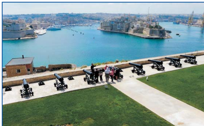
Výhled z horních zahrad ve Vallettě na Three Cities (Vittoriosa, Senglea, Cospicua)