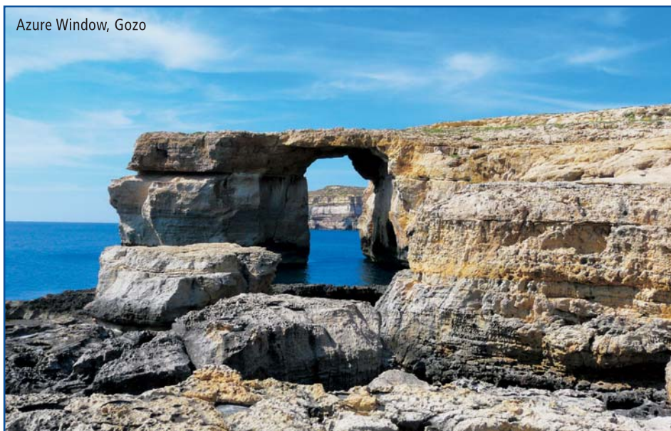
Azure Window, Gozo