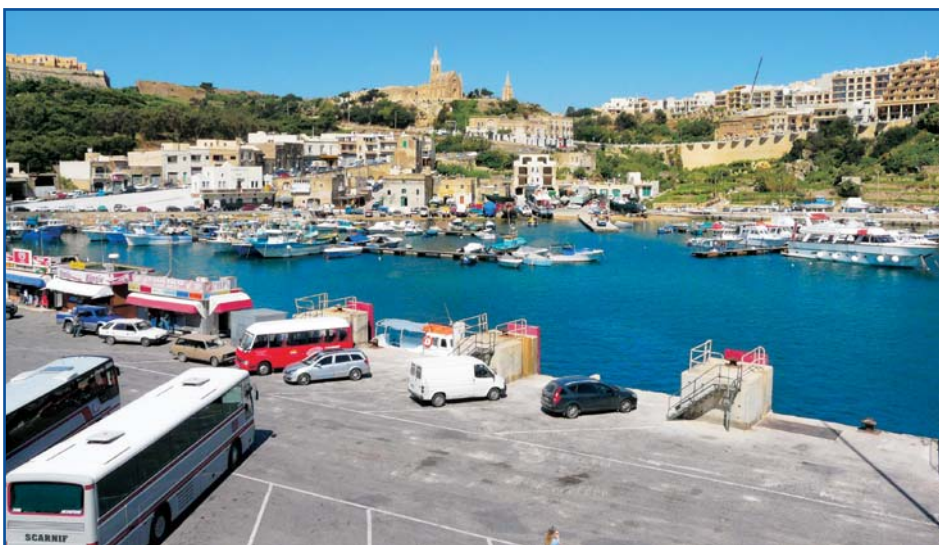
Přístav ve městě Mgarr na ostrově Gozo. Sem vás doveze trajekt z Malty.