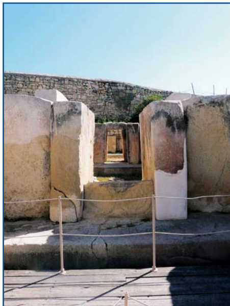
Tarxien Temples, megalitický chrám na Maltě

Většina škol patří do sdružení PADI. Místní školy vám nabídnou prvotřídní vybavení, spolehlivost a vynikající kvalitu. Poradí jak zkušeným potápěčům, tak i začátečníkům.