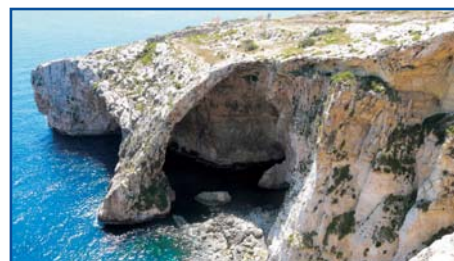
Blue Grotto, Malta