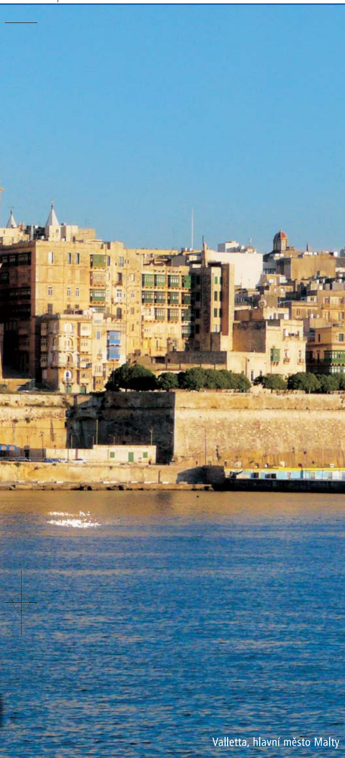
Valletta, hlavní město Malty

v tomto místě je dobrodružstvím, protože poblíž jsou velké nákladní lodě, z kterých házejí námořníci zbytky jídla, a to láká žraloky. Ale nikdy zde nebyl zaznamenán útok žraloka na člověka.