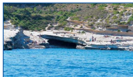
Bazén sv. Pavla