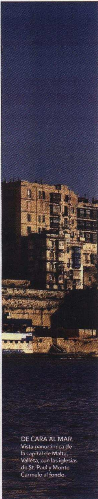
DE CARA AL MAR. Vista panorámica de la capital de Malta, Valletta, con las iglesias de St. Paul y Monte Carmelo al fondo.