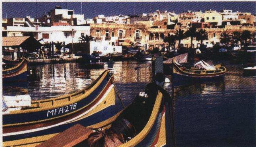
HISTORIA Y TRADICIÓN. Arriba, desfile popular ante la catedral de San Pablo, de Mdina. Debajo, Marsaxlokk, una localidad donde se pueden ver los pintorescos luzzus con el ojo de Osiris en su proa.

Unión Europea: "Desde un punto de vista económico, la industria cinematográfica incrementa nuestra importante industria turística. Ya que no sólo produce ingresos directos sino que permite proyectar la imagen de nuestro país en todo el mundo. Porque a pesar de que Malta sea usado a menudo para representar otros lugares, la repercusión publicitaria es muy importante".