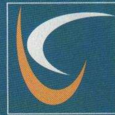
C.I.C.M.A N.º 541

La mayoría de los ciudadanos de este país son bilingües, hablan maltés e inglés. De hecho, es un lugar habitual para el estudio de idiomas, pero te recomendamos huir de esta marea teen.