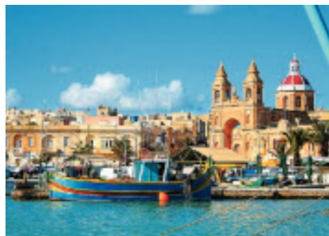
Idylle in Marsaxlokk: Mediterranes Flair mitten im Winter mit bunten Booten und netten Fischlokalen