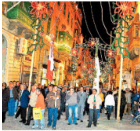
Spektakel in Valletta: Am 13. Dezember wird der Unabhängigkeitstag gefeiert. Die Blinklichter gibt's den ganzen Advent