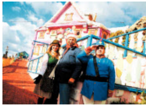
Hit für Kids: Im Filmdorf "Popeye's Village" begrüßt der Spinat essende Matrose die Gäste mit Weihnachtsmütze