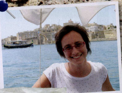
Eilandhoppen tussen Malta, Gozo en Comino.