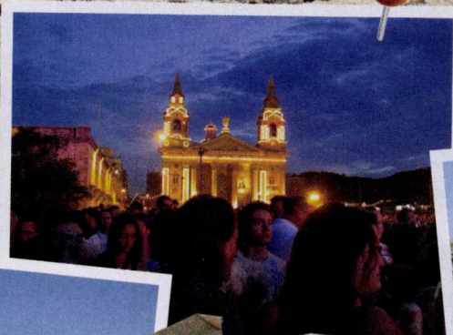
Concerten, beachparty's, op Malta is elke avond wel iets te doen!