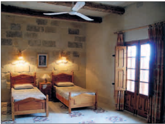
SOV I RO: Antall soverom varierer, men det er god plass med fotside vinduer og vifte til taket. Begge deler kan komme vel med.