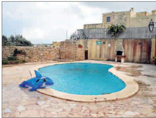
BADETID: I de lukkede gårdsrommene er det laget svømmebasseng som er mer enn stort nok avkjøling.