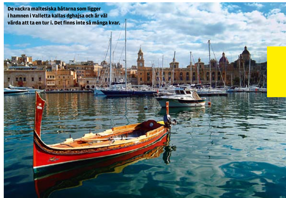
De vackra maltesiska båtarna som ligger i hamnen i Valletta kallas dghajsa och är väl värda att ta en tur i. Det finns inte så många kvar.