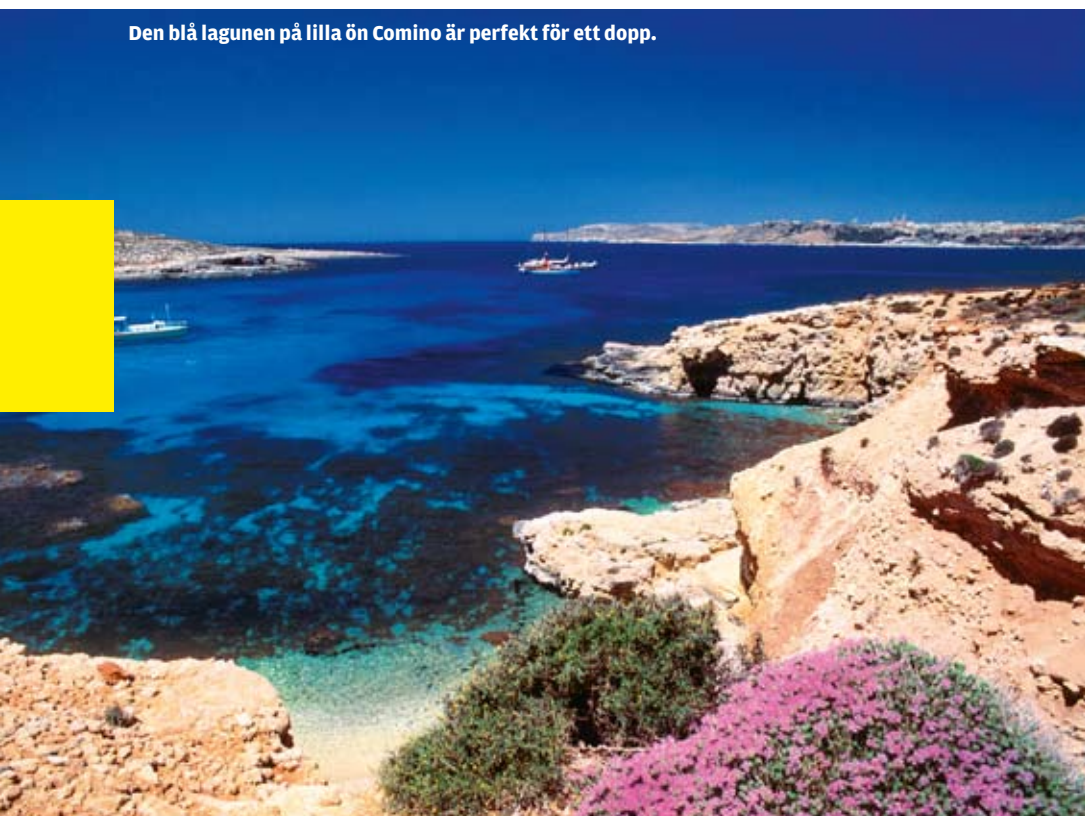
Den blå lagunen på lilla ön Comino är perfekt för ett dopp.