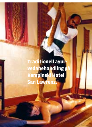
Traditionell ayurvedabehandling på Kempinski Hotel San Lawrenz.