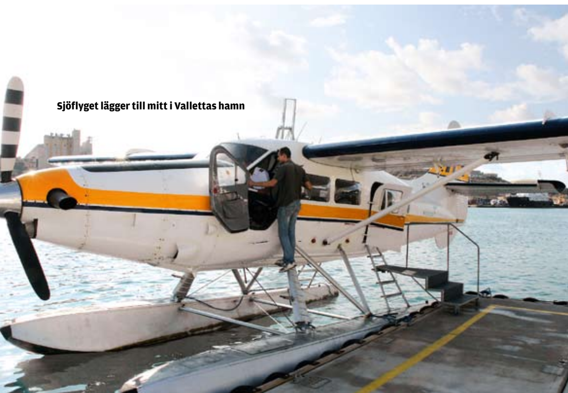
Sjöflyget lägger till mitt i Vallettas hamn