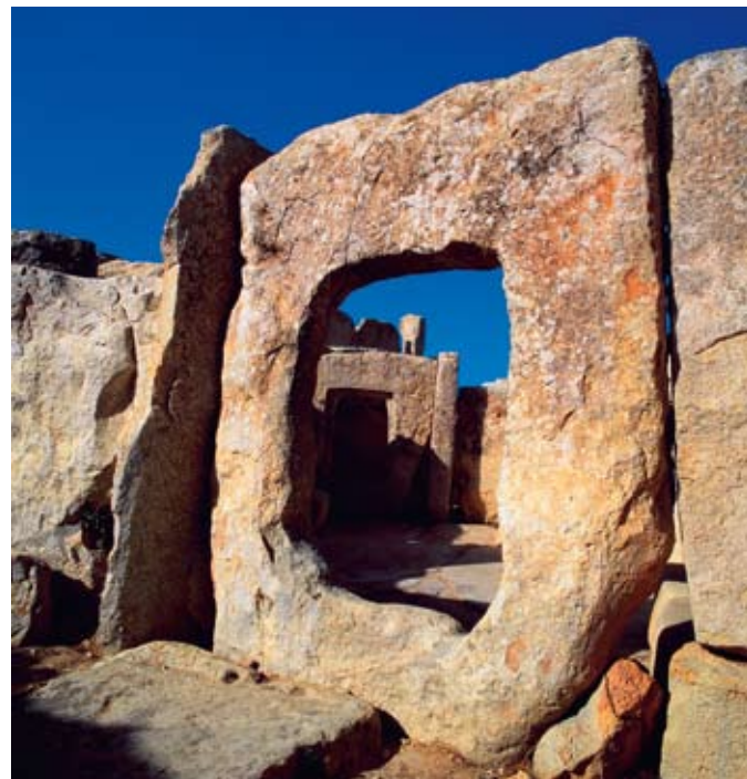
En bild kan inte göra interiören i barockstil inne i St Johns Co-Cathedral rättvisa. Hela katedralen glittrar i guld från golv till tak och golvet är täckt av över 300 marmortavlor under vilka riddare vilar.