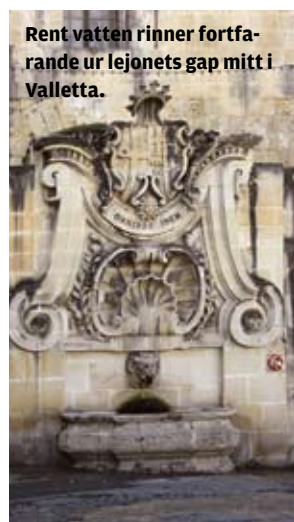
Rent vatten rinner fortfarande ur lejonets gap mitt i Valletta.