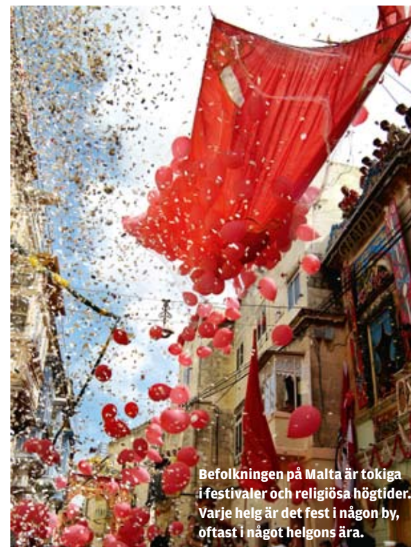
Befolkningen på Malta är tokiga i festivaler och religiösa högtider. Varje helg är det fest i någon by, oftast i något helgons ära.