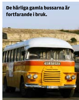
De härliga gamla bussarna är fortfarande i bruk.