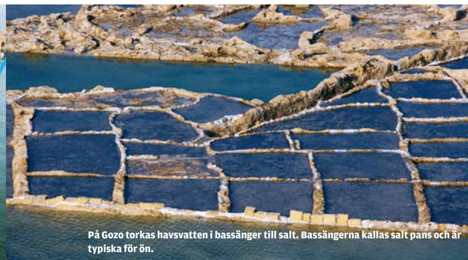
På Gozo torkas havsvatten i bassänger till salt. Bassängerna kallas salt pans och är typiska för ön.