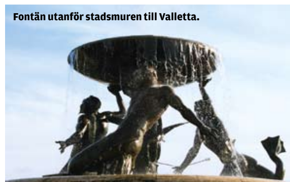
Fontän utanför stadsmuren till Valletta.