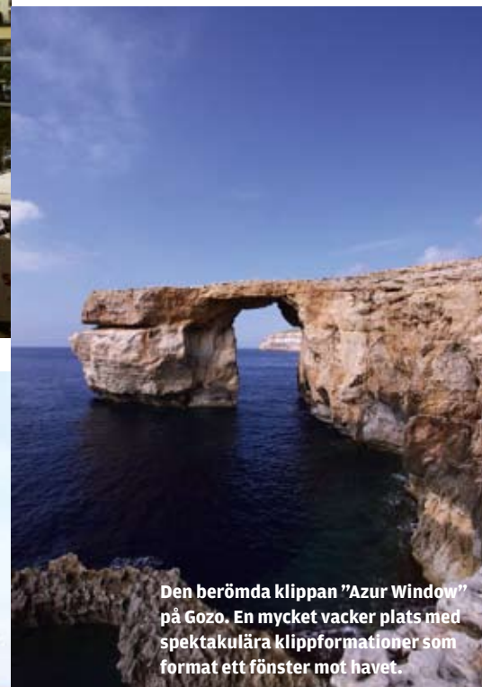
Den berömda klippan "Azur Window" på Gozo. En mycket vacker plats med spektakulära klippformationer som format ett fönster mot havet.