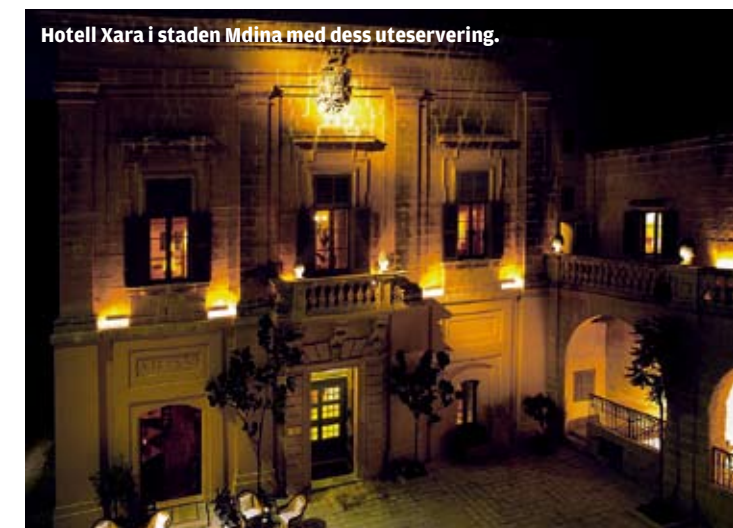
Hotell Xara i staden Mdina med dess uteservering.