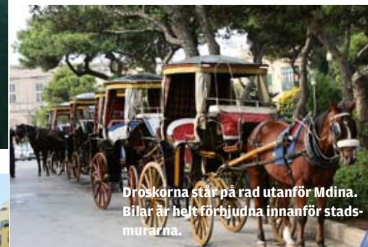
Dröskörna står på rad utanför Mdina. Bilar är helt förbjudna innanför stadsmurarna.