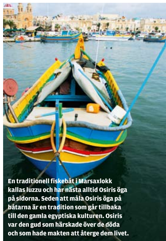
En traditionell fiskebåt i Marsaxlokk kallas luzzu och har nästa alltid Osiris öga på sidorna. Seden att måla Osiris öga på båtarna är en tradition som går tillbaka till den gamla egyptiska kulturen. Osiris var den gud som härskade över de döda och som hade makten att återge dem livet.