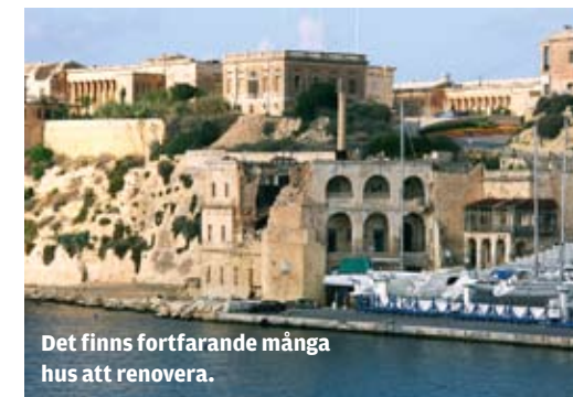
Det finns fortfarande många hus att renovera.