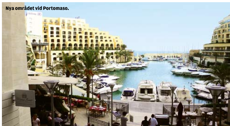
Nya området vid Portomaso.