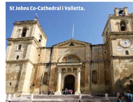
St Johns Co-Cathedral i Valletta.