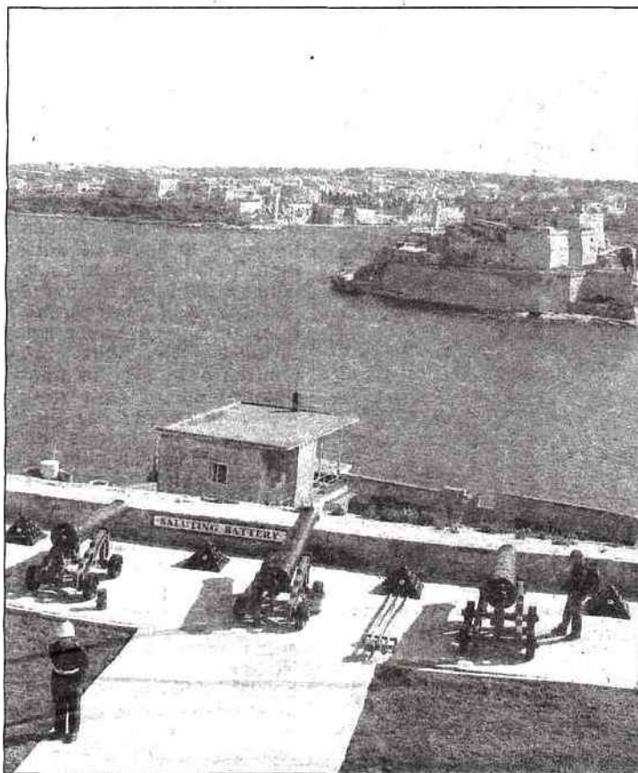
Des Jardins de Barraca à La Valette, la vue est imprenable sur les Trois Cités.

1837), il faudra bien un kinnie, cette boisson à l'orange amère et aux herbes aromatiques, des pastizzi (pâte feuilletée farcie au fromage ou aux petits pois), des imqarats (gâteaux chauds aux dattes, servis traditionnellement sur le marché typique de Marsaxlokk au sud-est de l'île) pour se remettre de ce bref retour dans le temps.