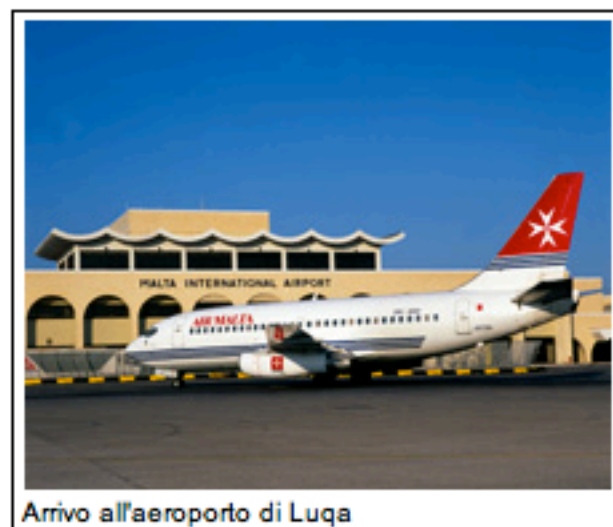
Arrivo all'aeroporto di Luqa

Dall'aeroporto internazionale di Luqa, arrivo a St. Julian's, sulla costa nord, poco oltre Sliema, per la probabile sistemazione alberghiera. La zona è ricca di hotel, ristoranti, locali per il divertimento e lo shopping. Da St. Julian's, trasferimento a Valletta , la capitale delle isole maltesi. Prima di visitare i monumenti più insigni, previsti in questo itinerario, varrà la pena di assistere, presso il Mediterranean Conference