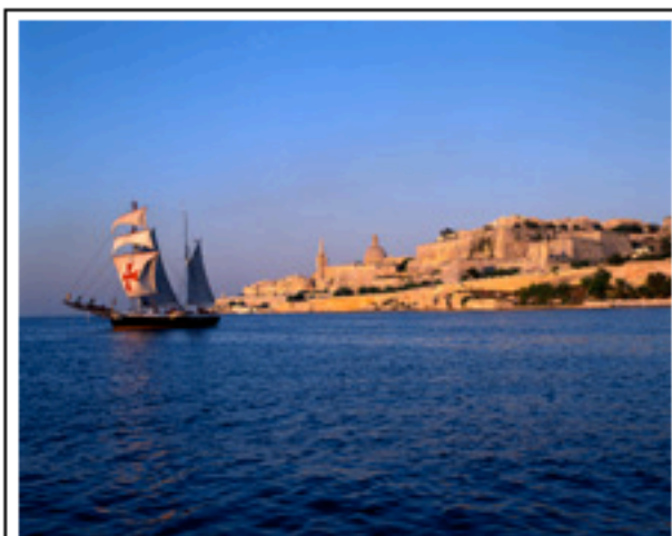
Il porto di Marsamxett

Un arcipelago minuscolo tra Europa e Africa. Alcune idee e suggerimenti per utilizzare al meglio una vacanza breve alla scoperta dei molti "tesori" di Melita, luogo ideale per un ponte primaverile dove è già estate