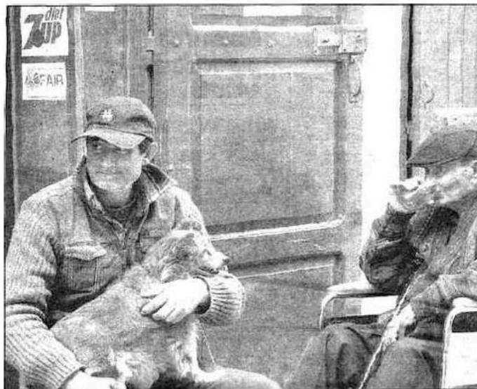
Comme tous les Méditerranéens, l'heure de la sieste et de la pause-café est sacrée.

sisante le dallage de l'édifice. Les yeux au ciel, il jetterait un regard marqué sur cette voûte ornée de peintures en trompe l'œil signées Mattia Preti. Aujourd'hui, le musée de la cathédrale garde jalousement des chefs-d'œuvre du Caravage. L'épée au fourreau, il aurait poursuivi sa route au palais des Grands Maîtres, qui fut le siège de l'ordre de Saint-Jean, désormais siège du parlement maltais. Sans doute aurait-il