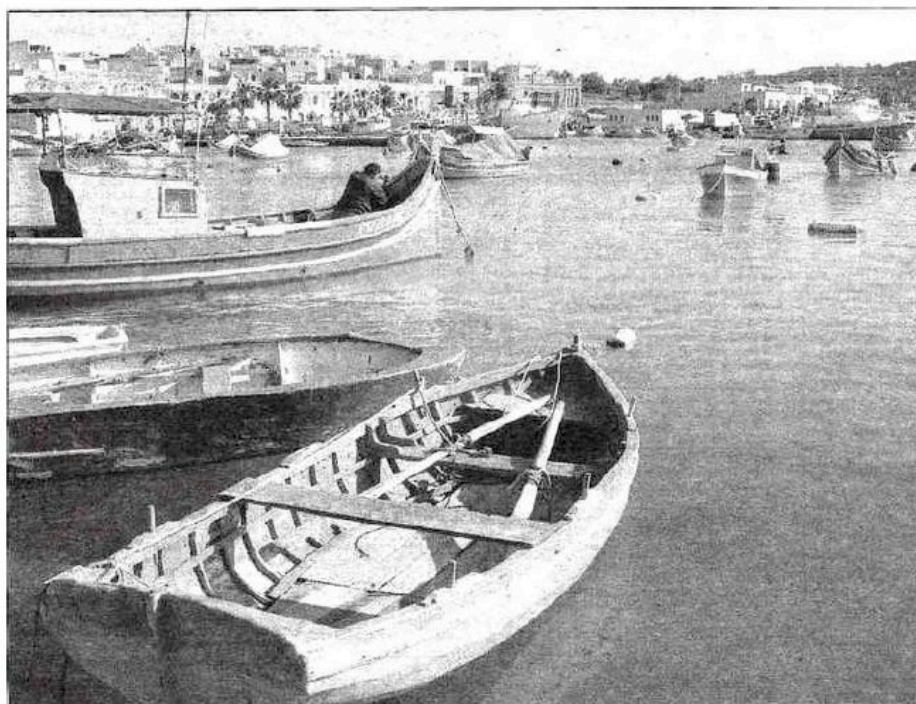
De nombreuses criques s'ouvrent sur de petits ports de pêche authentiques avec ces barques très typiques de Malte.

Fascinant aussi cette empreinte chevaleresque dont il est impossible d'échapper à La Valette, capitale de Malte, du nom de son fondateur, Jean Parisot de la Valette. Dans la vieille ville, la période médiévale y est encore palpable et on pourrait presque s'attendre à croiser au détour d'une ruelle un vaillant chevalier et sa monture. On se plaît à imaginer qu'il se dirigerait tout droit vers la cathédrale Saint-Jean, qui recèle de magnifiques polychromes. Il pourrait se recueillir sur les pierres tombales des chevaliers de l'ordre de Saint-Jean, formant de façon sai-