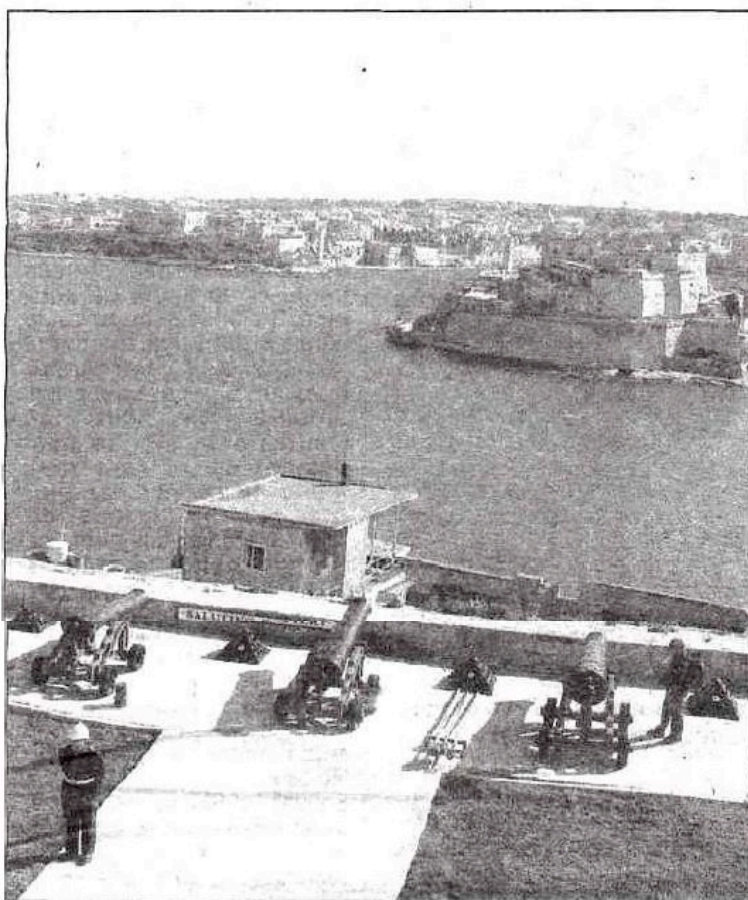
Des Jardins de Barracca à La Valette, la vue est imprenable sur les Trois Cités.

1837), il faudra bien un kinnie, cette boisson à l'orange amère et aux herbes aromatiques, des pastizzi (pâte feuilletée farcie au fromage ou aux petits pois), des imqarets (gâteaux chauds aux dattes, servis traditionnellement sur le marché typique de Marsaxlokk au sud-est de l'île) pour se remettre de ce bref retour dans le temps.