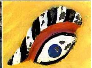
L'œil peint sur les luzzi (barques) est censé protéger les pêcheurs.