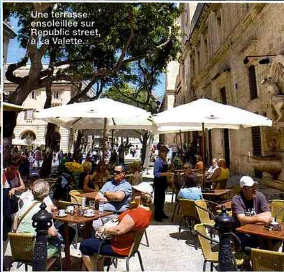
Une terrasse ensoleillée sur Republic street, à La Valette.