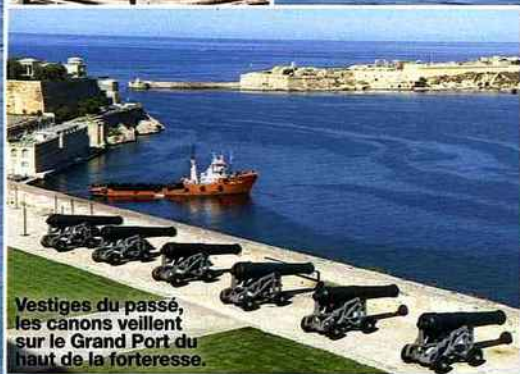
Vestiges du passé, les canons veillent sur le Grand Port du haut de la forteresse.

A vec ses 320 monuments, La Valette a de quoi passionner les amateurs de vieilles pierres, mais pas seulement ! Rendez-vous en famille, le dimanche à 11 heures, au fort Saint-Elme où l'histoire des chevaliers de Malte se raconte en costumes ( In Guardia ). Ou bien assistez à The Malta Experience , un spectacle audiovisuel qui retrace l'histoire de cette île si convoitée, devenue un temps colonie anglaise. Ensuite, changez de registre et poussez jusqu'au parc d'attractions d'Anchor Bay,