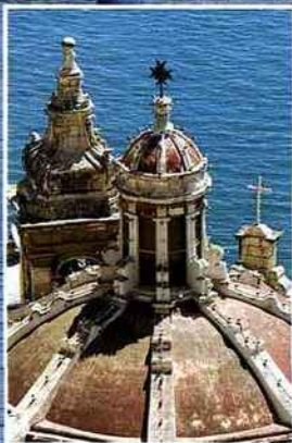
◀ Certains Maltais affirment qu'il y a 365 églises sur l'île.