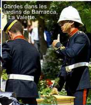
Gardes dans les jardins de Barracca, à La Valette.