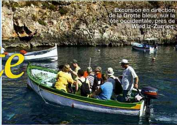
Excursion en direction de la Grotte bleue, sur la côte occidentale, près de Wied iz-Zurrieg.