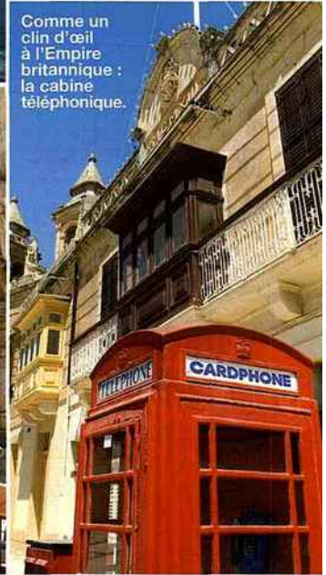
Comme un clin d'œil à l'Empire britannique : la cabine téléphonique.