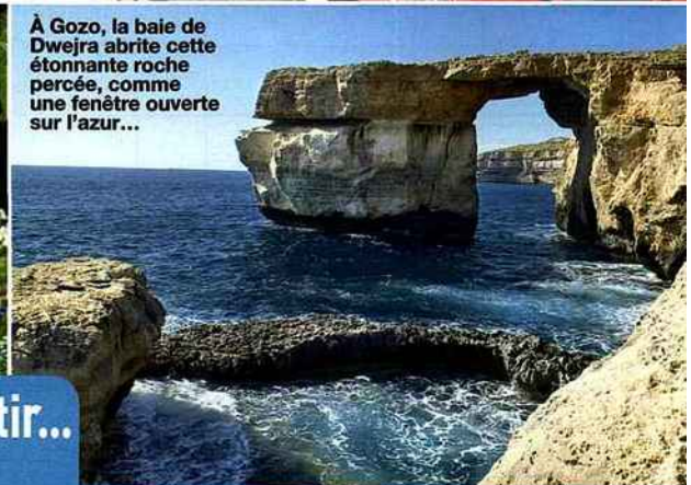
À Gozo, la baie de Dwejra abrite cette étonnante roche percée, comme une fenêtre ouverte sur l'azur...